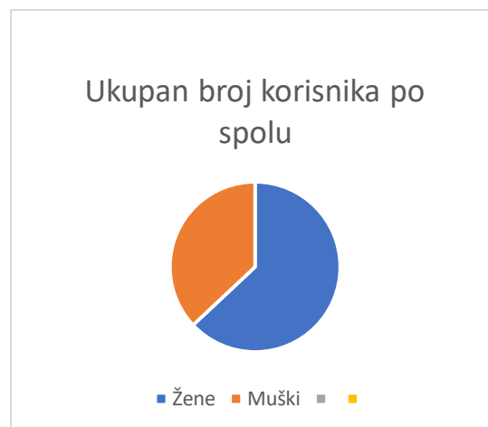
Graf 1. Prikazuje kao je u izvještajnom razdoblju od ukupnog broja korisnika 63% njih ženskog (157), a 37% muškog (94) spola.

Standardi navode kako pravo korištenja usluga narodne knjižnice imaju svi stalni i privremeni stanovnici područja pod istim uvjetima, a preporučuje se najmanje 18% učlanjenih korisnika od ukupnog broja stanovnika područja na kojem knjižnica djeluje. Prema popisu stanovnika iz 2021. godine, Općina Kolan broji 815 stanovnika. U prošloj godini Knjižnica je imala 251 učlanjena korisnika, što iznosi skoro 31% od ukupnog broja stanovnika na području Općine Kolan. Broj aktivnih posuđivača s registriranom posudbom u prošloj godini je 163, što iznosi gotovo 65% aktivnih članova od ukupnog broja upisanih članova.